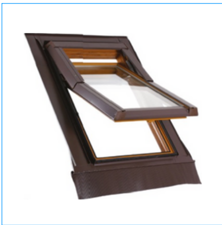
Kołnierz do pokryć falistych