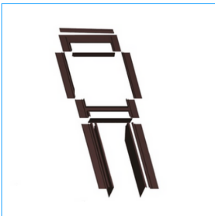
Kołnierz kolanowy falisty "F" i płaski "P"