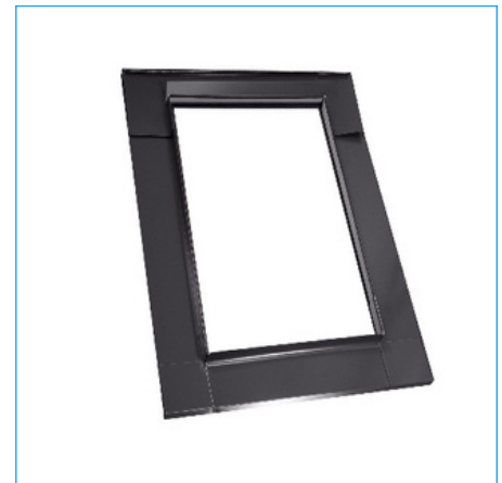
Kołnierz do pokryć płaskich

*Kołnierze specjalne umożliwiają montaż okien obok siebie lub jedno nad drugim.