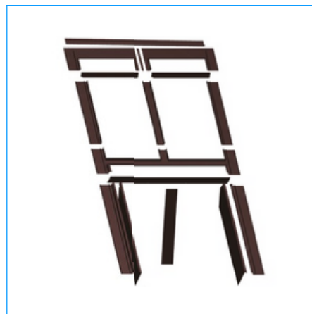
Kołnierz modułowy kolanowy falisty "F" i płaski "P"