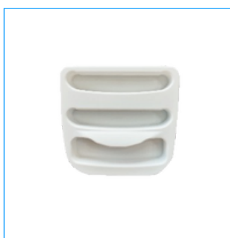
Gniazda klamek SUPRO