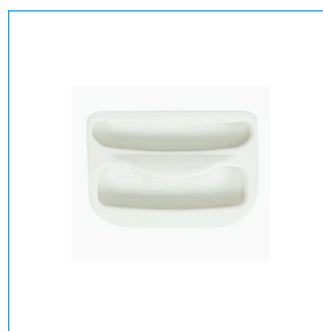
Alloggiamenti delle maniglie Skylight