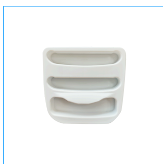
Alloggiamenti delle maniglie SUPRO