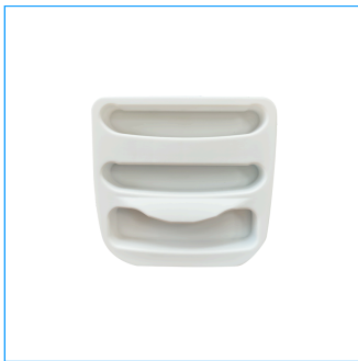
Prises de poignée SUPRO