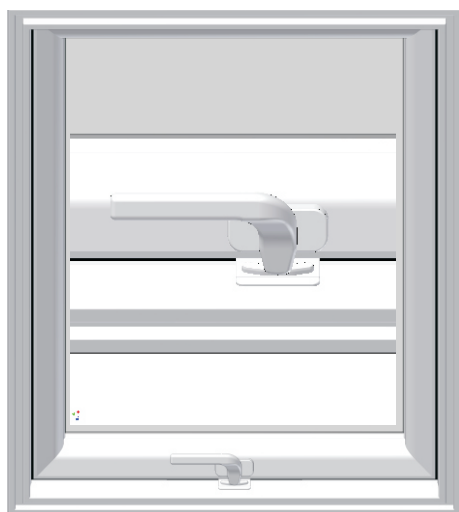
1. Pozycja zamknięta.