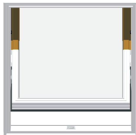
6. Pozycja do mycia. Skrzydło odwrócone o 120°.

A, B - wkręty zaciskowe C - wkręt regulacji