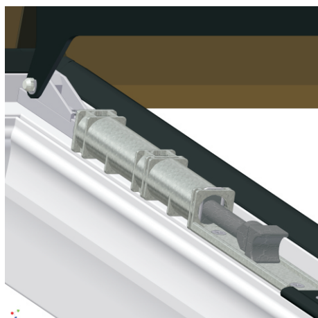
4. Okucie amortyzujące nie wymaga żadnej regulacji.