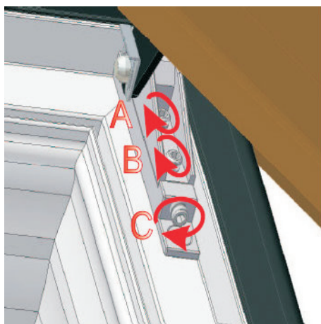
5. Regulacja wysokości położenia skrzydła w ościeżnicy.

A, B - wkręty zaciskowe C - wkręt regulacji